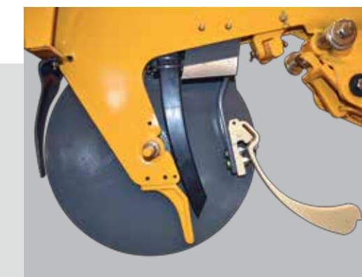
SENSOR DE SEMILLA INFRARROJO